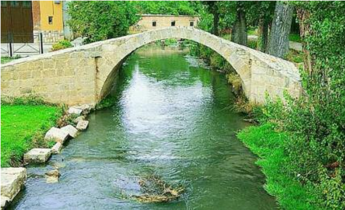
Imagen del puente medieval que puede visitarse en Calamocha