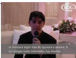
Entrevista a Paperghost, gurú de seguridad informática