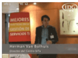
Mejores Prácticas en la Gestión de Servicios TI